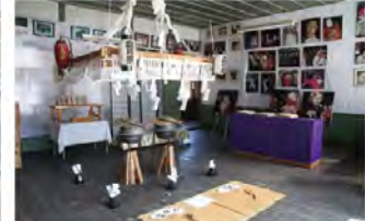
●祭りの資料館(5年生教室) 木沢地区の霜月祭りを紹介。

料金:入場料無料(基本無料ですが校舎維持のための協力金としてご協力をお願いします。) 定休日:年中無休 ☎0260-34-1071(遠山郷観光協会)