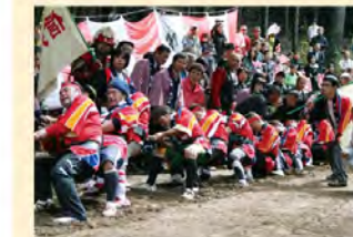
●峠の国盗り綱引き合戦(10月) 信州軍(飯田市南信濃)と遠州軍(浜松市水窪町)、双方の若者10人が綱引きをし、勝った方が「県境」を1メートル広げることができるというユニークなイベント。