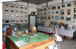
●山の資料館(2年生教室) 南アルプスに関する資料を展示。