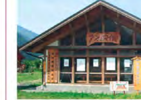
●遠山温泉郷 かぐらの湯 源泉温度は約43度、飲むと独特の塩味があるナトリウム・カルシウム塩化物温泉。大浴場、広々とした岩の露天風呂、サウナなどを完備しており、ゆったりと入浴を楽しめます。 営業時間:10:00~21:00(受付20:30まで) 定休日:木曜日(祝祭日は営業) 料金:大人630円・小人320円 ☎0260-34-1085