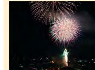
●御射山祭り(8月) 谷の夜空を覆う大輪の花火、山々にこだまするその轟音は迫力満点。