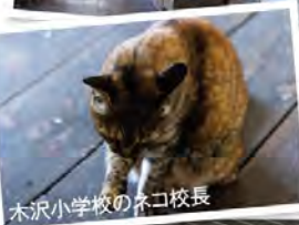
木沢小学校のネコ校長

昭和7年に建てられ、平成12年に廃校となった木造校舎。ぬくもりとノスタルジーがいっぱい。地元住民の手で保存され、資料館やイベントスペースとして活用されています。