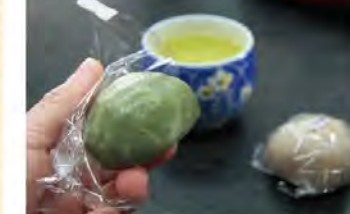
●殿町の茶屋 地元女性グループが作るよもぎとそばの「ふじ姫饅頭」が名物。午前中に行かないと売り切れてしまうほどの人気です。 定休日:火曜日 ☎0260-34-5623