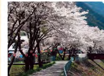
●遠山桜・河津桜 道の駅周辺と遠山川の堤防沿いには、3月中旬から見頃を迎える河津桜200本、4月上旬から咲き始めるソメイヨシノ約70本が春を彩ります。