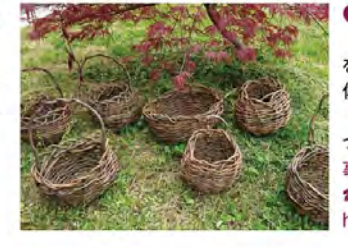
●織物体験(遠山ふじ糸伝承の会) 遠山産の山藤の蔓から糸を紡ぐ、藤糸の文化を伝承している会。藤づる籠編み体験、藤織り体験などのワークショップも開催(要予約)。また、当会の会員たちが営む、民泊体験も行っていただけます。 事務局:長野県飯田市南信濃和田342 ☎080-8478-7884 http://fujitonokai.jimdo.com