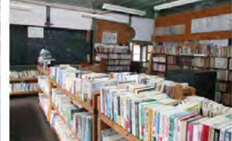
●山の図書館 旧蔵書や寄贈本など4千冊以上が閲覧できる。