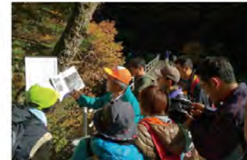
●森林鉄道ウォーキング 地元グループが毎年11月上旬~中旬に開催するウォーキングイベント。現在も残る軌道跡を歩きます。林鉄の元職員など地元ガイドの解説を聞きながら、美しい紅葉とさわやかな秋の空気を楽しみます。

料金:入場料無料(基本無料ですが校舎維持のための協力金としてご協力をお願いします。) 定休日:年中無休 ☎0260-34-1071(遠山郷観光協会)