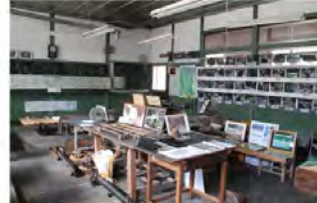
●林鉄資料館(4年生教室) 森林鉄道の資料を展示。