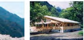
●織物体験(遠山ふじ糸伝承の会) 遠山産の山藤の蔓から糸を紡ぐ、藤糸の文化を伝承している会。藤づる籠編み体験、藤織り体験などのワークショップも開催(要予約)。また、当会の会員たちが営む、民泊体験も行っていただけます。 事務局:長野県飯田市南信濃和田342 ☎080-8478-7884 http://fujitonokai.jimdo.com