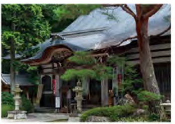
●龍淵寺 遠山氏の菩提寺である曹洞宗の寺で、境内の大杉のふもとには遠山氏の墓があります。裏の盛平山には三十三観音を巡るハイキングコースも。