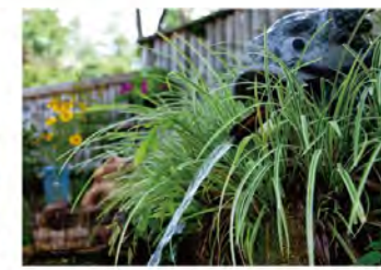
●観音霊水 龍淵寺の境内に湧き、環境省の「平成の名水百選」にも選ばれています。カルシウムとマグネシウム、炭酸水素を非常に多く含むバランスのとれた名水(硬度225.5)です。