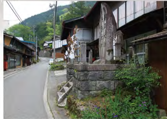
昔ながらの面影が残る上町宿(旧秋葉街道)

文化展示施設や直売所などもおすすめです。中郷、程野などの近隣集落には、昔ながらの山村の暮らしが息づいています。