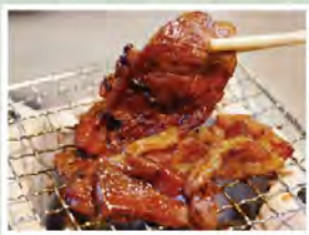
—遠山の味付ジンギス—

「ジンギスカン」ではなく「ジンギ」と呼ぶのが遠山流。マトンを秘伝のタレに漬け込んでいます。