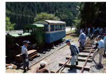
●遠山森林鉄道 南アルプスの豊富な木材を搬出するため昭和19年に建設され、年々延伸して昭和30年代には総延長30.5kmに達しました。貨車の数は多い時で242台、木材運搬だけでなく沿線集落の人々の足としても活躍し、「林鉄」の名で親しまれました。昭和48年にすべてのレールが撤去されてその役割を終えましたが、近年、梨元ていしや場の敷地内に軌道を再建し、機関車を走らせる復元作業が進んでいます。 ※資料及び道具類・遺構群が2018年林業遺産(No.28)に選定。

上町、下栗、和田を結ぶ秋葉街道の要所に位置する宿場町。遠山森林鉄道の起点として栄えました。昔ながらの木造校舎が保存され、住民手作りの展示施設、交流拠点として活用されています。