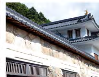
●せせらぎの里 陶芸館 絵付けやろくろ、手びねりなど、陶芸が手軽に体験できます。素朴な「遠山焼」の展示販売も行なっています。 定休日:火曜日 ☎0260-34-2100