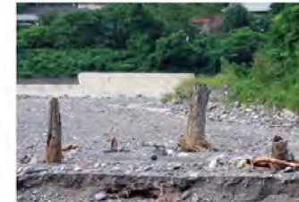
●埋没林 約1300年前の大地震による河川氾濫で土砂に埋もれたと推測されている杉の巨木。地質遺産としての価値が高く、このエリアは「日本ジオパーク」の登録エリアに指定されています。